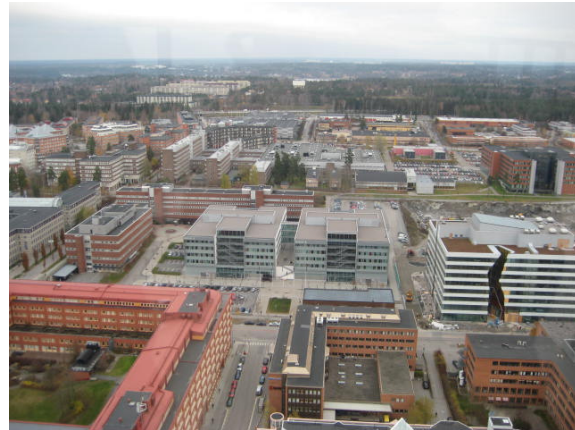
Vista general de Kista

Tras pasar el resto de la tarde entre reuniones y paseos por el centro antiguo de Estocolmo, vamos todos juntos a cenar al restaurante KB, que nos ofrece una magnífica oportunidad para conocernos todos algo mejor y discutir sobre posibles oportunidades de una manera distendida e informal.