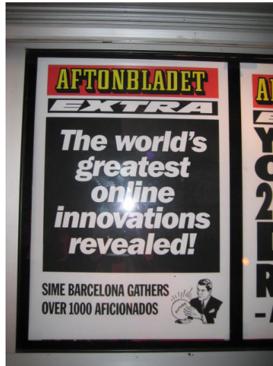
Anuncio para el próximo SIME en Barcelona